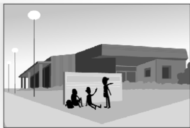
a scuola elementare "Carlo Piaggia"