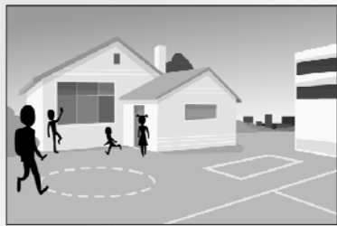
la scuola elementare "Savio"