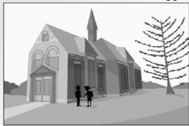
la scuola elementare "G. Puccini"

Vado alla scuola elementare "G. Puccini". Faccio la quinta elementare.