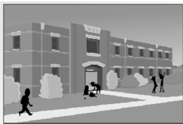
la scuola secondaria "A. Manzoni"